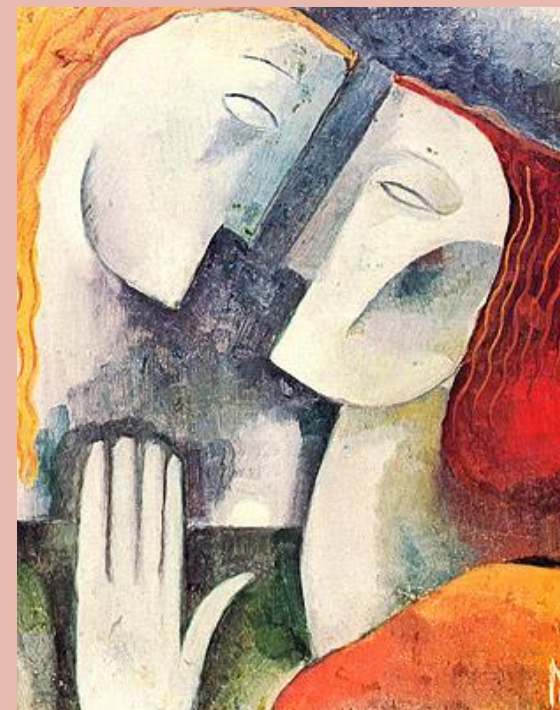
Ismael Nery - Namorados

Su richiesta verranno rilasciati gli Attestati di partecipazione al Convegno.